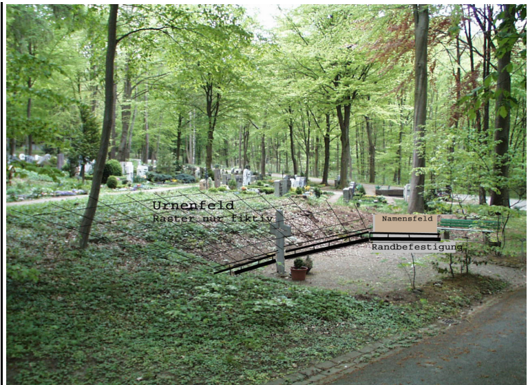
Anlage eines Urnenfeldes