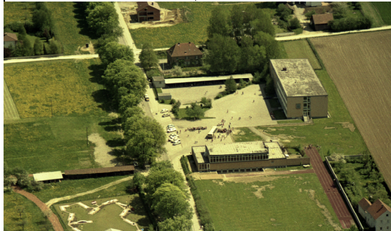
Im Februar konnte die Kleinschwimmhalle im Kellergeschoss der Volksschulturnhalle an der Reichenbacher Straße fertiggestellt und eröffnet werden.