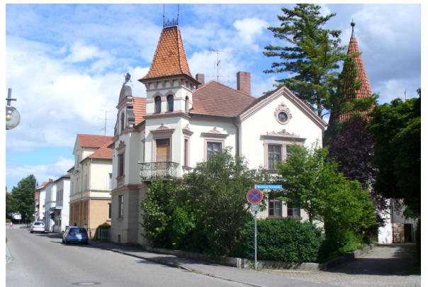
Wohnhaus, mit Zwerchgiebel und Ecktürmchen, Gliederung in barockisierender Neurenaissance, Rustikasockel. erbaut 1905, Renovierung 1986, Fenstererneuerung 2012 und 2020